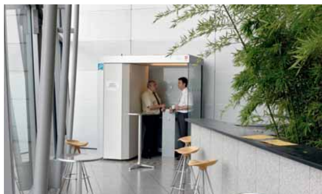
INDIVIDUAL LINE - A-Variante

Mit der INDIVIDUAL LINE kann technischer Nichtraucherchutz in breiten Fluren und Fluchtwegen, in Alten- und Pflegeheimen, in Krankenhäusern und öffentlichen Einrichtungen geschaffen werden.