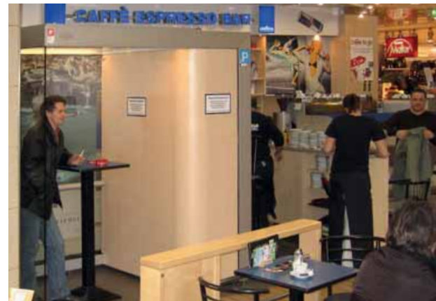
HORECA LINE - in einer Café Bar (individualisiert gemäß Bundeslandgesetzgebung)