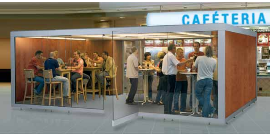
HORECA LINE XXL