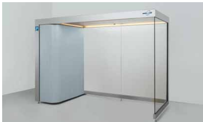
INDIVIDUAL LINE - barrierefrei