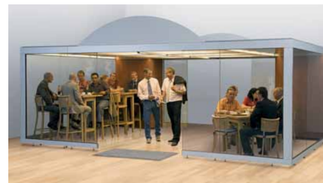
DESIGN LINE XXL