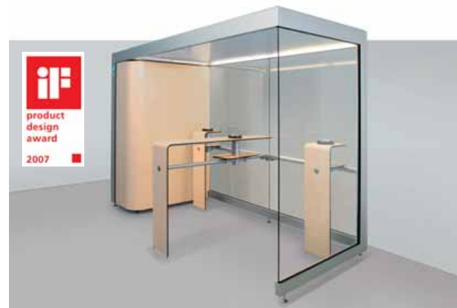
DESIGN LINE - ausgezeichnet mit dem iF Product Design Award 2007

Die DESIGN LINE ist ideal zur Aufstellung in Hotels, Empfangsbereichen, Konferenzräumen, repräsentativen Gästebereichen und überall dort, wo ein Extra an Design gefragt ist.