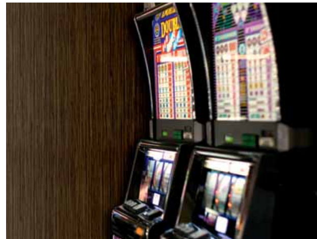
HORECA LINE - optimiert für den Einsatz von Spielautomaten