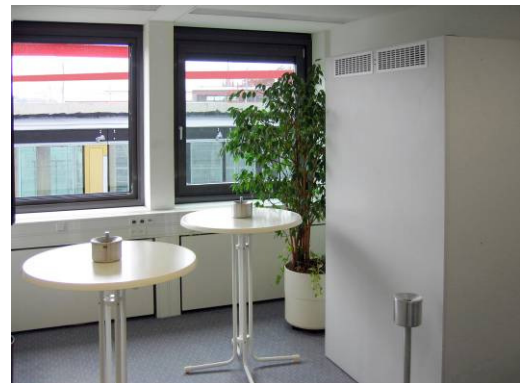
Luftreiniger XXL in einem Raucherraum